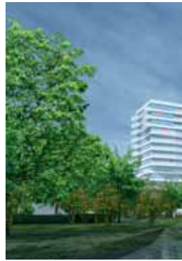
Impressie van de plannen voor