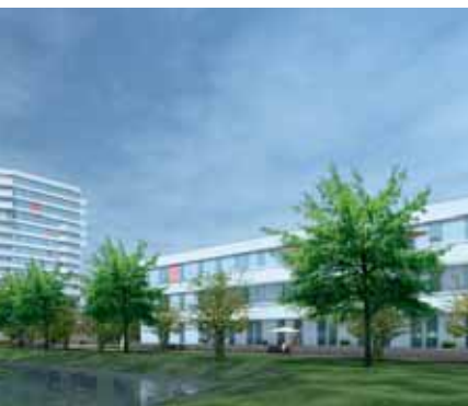
wonenCentraal in Park.